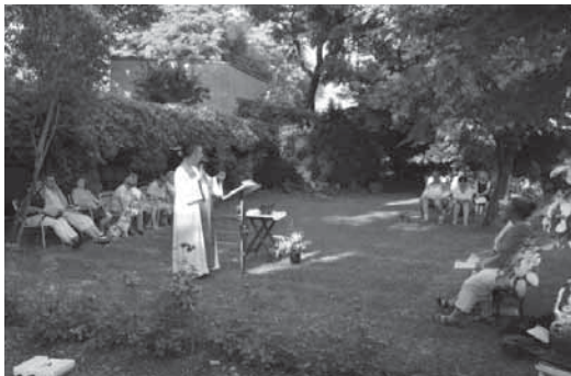
Gottesdienst für Mensch und Tier im Pfarrgarten