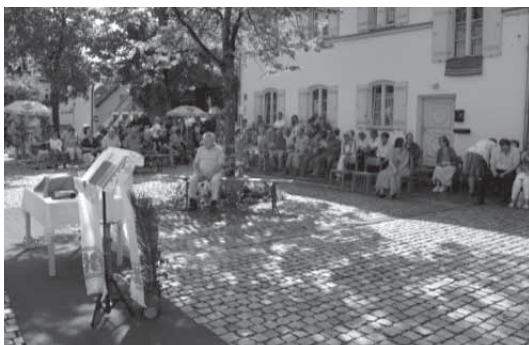
Portiunkulasonntag – Hl. Messe vor dem Franziskanerinnenkloster in unserem Pfarrgebiet